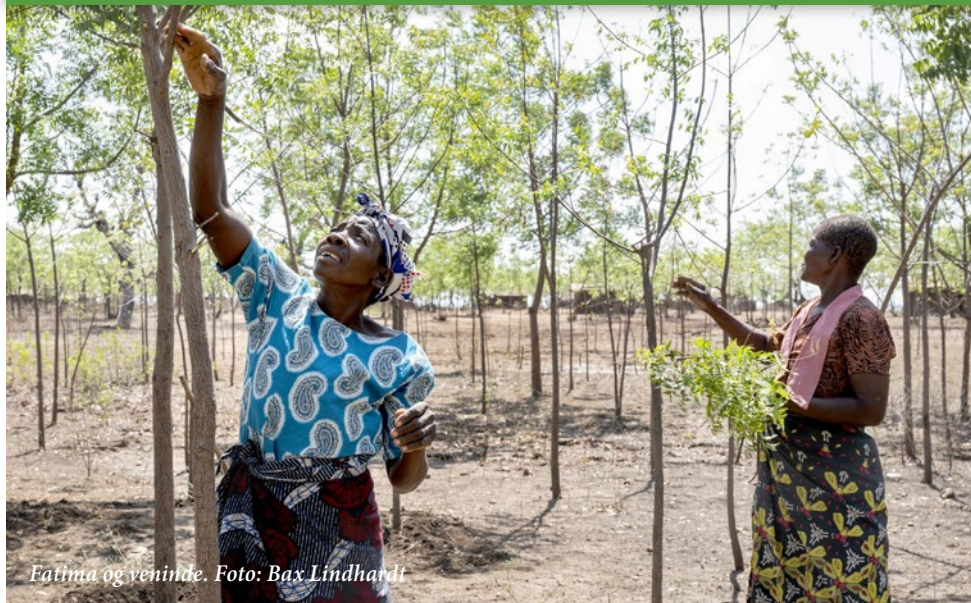
Fatima og veninde.