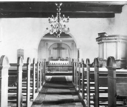
Kallerup Kirke før 1936

Nu har menighedsrådet så fået brev fra stiftet om, at der er givet grønt lys for at fjerne kirkebænke mm. dog skal den nye indretning nøje beskrives og anskueliggøres, før alle knapper lyser grønt.