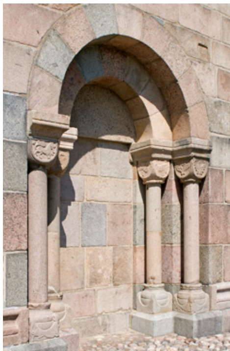
Sydportalen blev reetableret i 1875.