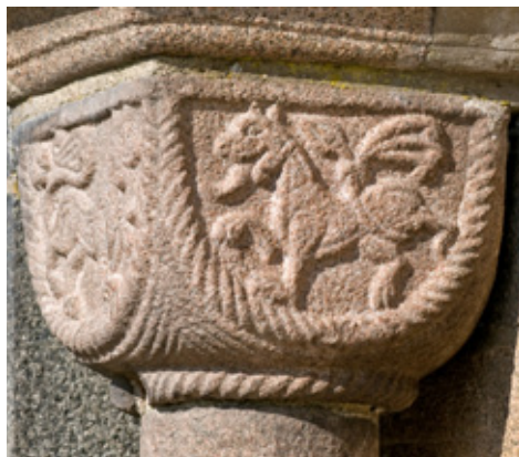
Kapitæl med to relieffer af løver i skjoldformede felter.